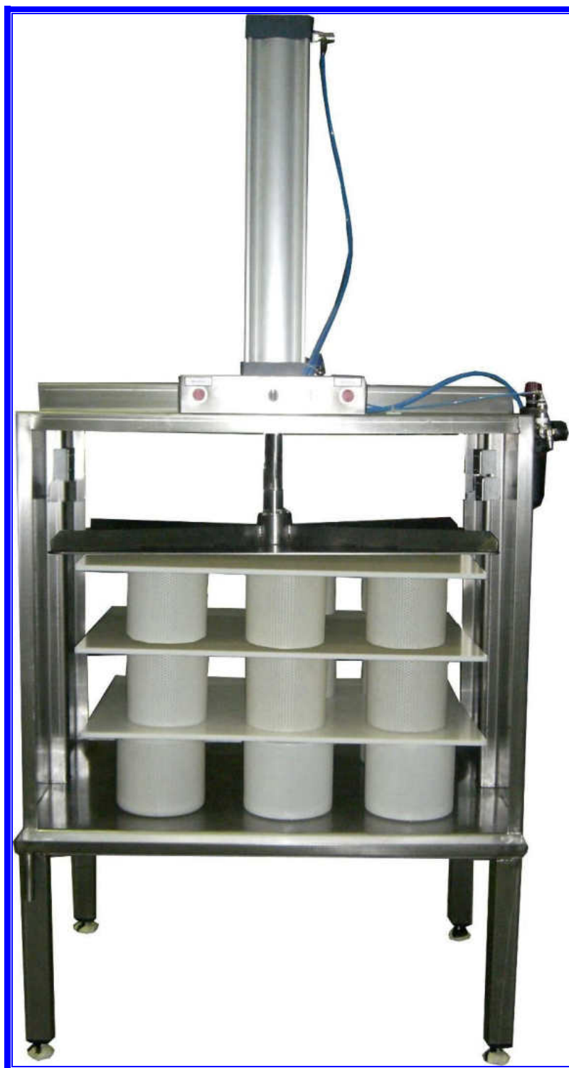
PRESSA PNEUMATICA PER FORMAGGI. Modello a 1 colonna 3 ripiani.

Magnabosco S.r.l. – Via Roma, 19 – 36030 Zugliano (VI) – Tel. 0445/330111 – Fax 0445/330110-222 e-mail: magnabosco@magnabosco.com