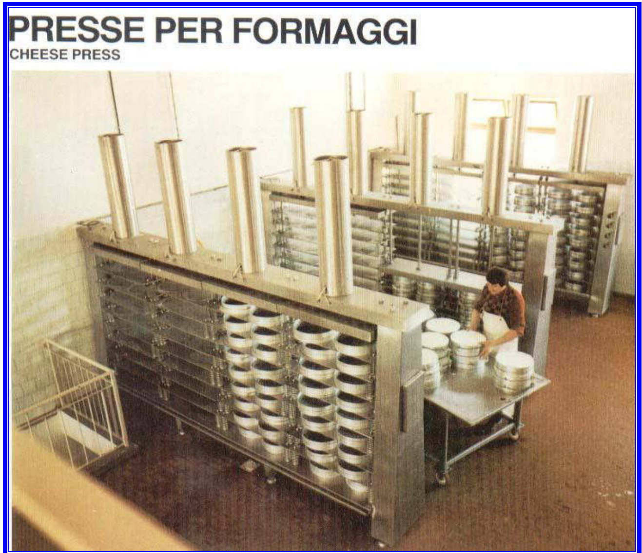
PRESSA PNEUMATICA PER FORMAGGIO. Modello a quattro colonne.