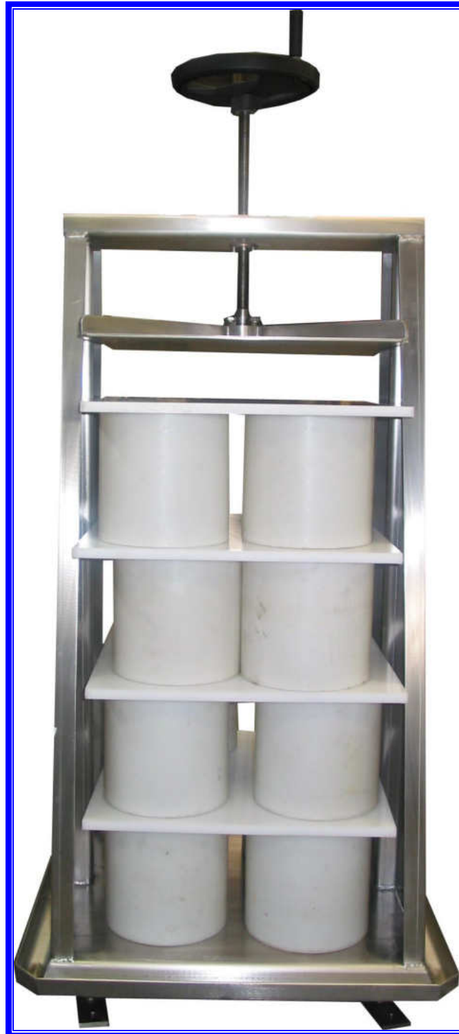
PRESSA MANUALE ORIGINALE "MAGNABOSCO" Modello ad una colonna