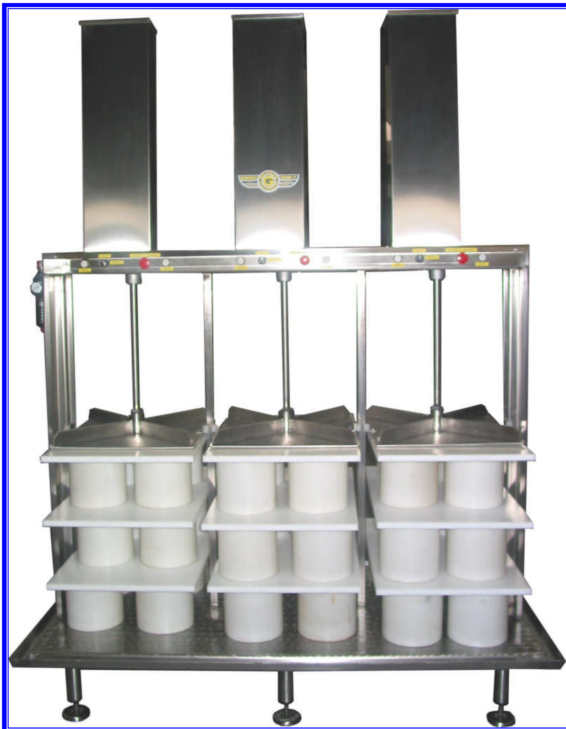
PRESSA PNEUMATICA ORIGINALE "MAGNABOSCO" Modello a tre colonne

Magnabosco S.r.l. – Via Roma, 19 – 36030 Zugliano (VI) – Tel. 0445/330111 – Fax 0445/330110-222 e-mail: magnabosco@magnabosco.com