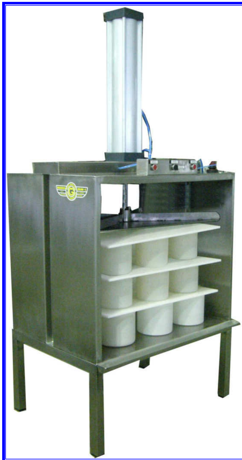
PRESSA PNEUMATICA PER FORMAGGI. Modello a 1 colonna 3 ripiani.

Magnabosco S.r.l. – Via Roma, 19 – 36030 Zugliano (VI) – Tel. 0445/330111 – Fax 0445/330110-222 e-mail: magnabosco@magnabosco.com