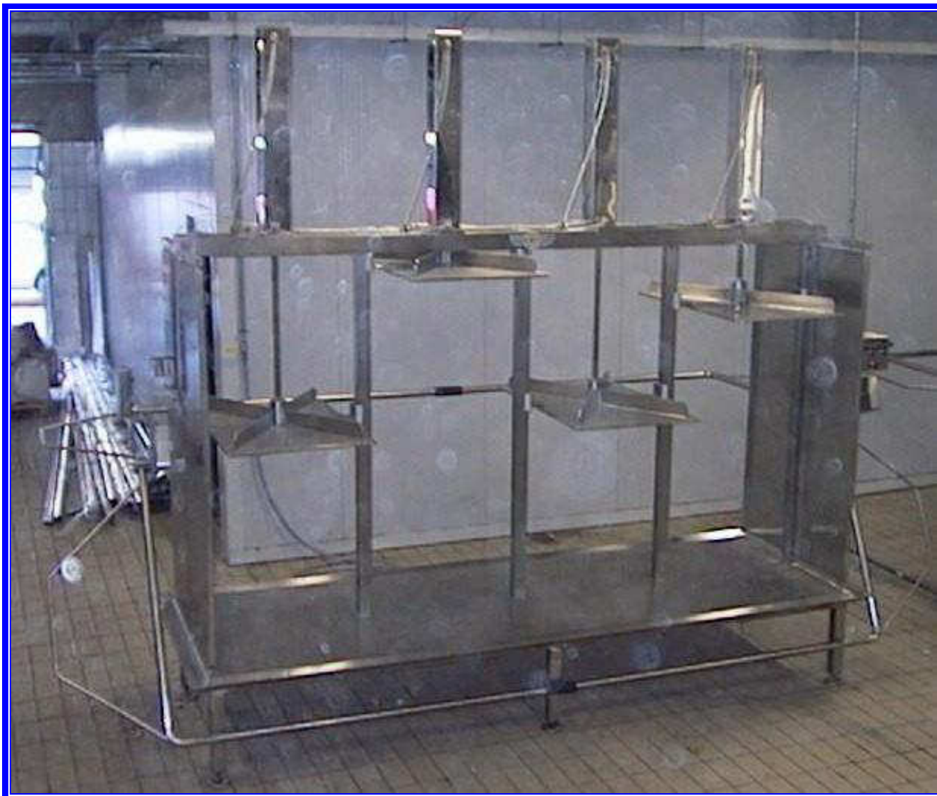
PRESSA PNEUMATICA PER FORMAGGIO. Modello a 4 colonne.