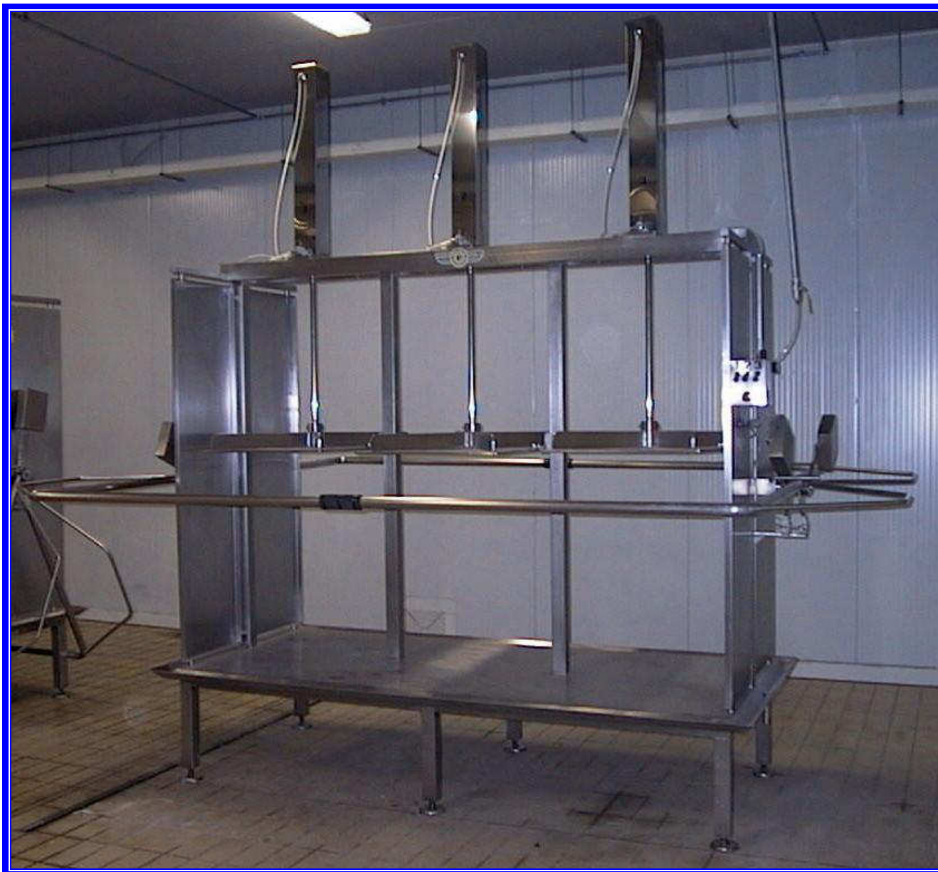
PRESSA PNEUMATICA PER FORMAGGIO. Modello a tre colonne.