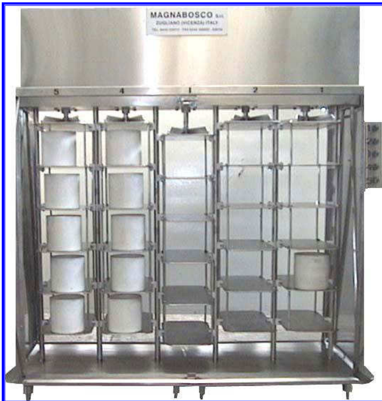
PRESSA PNEUMATICA PER FORMAGGI. Modello a cinque colonne e 8 ripiani.