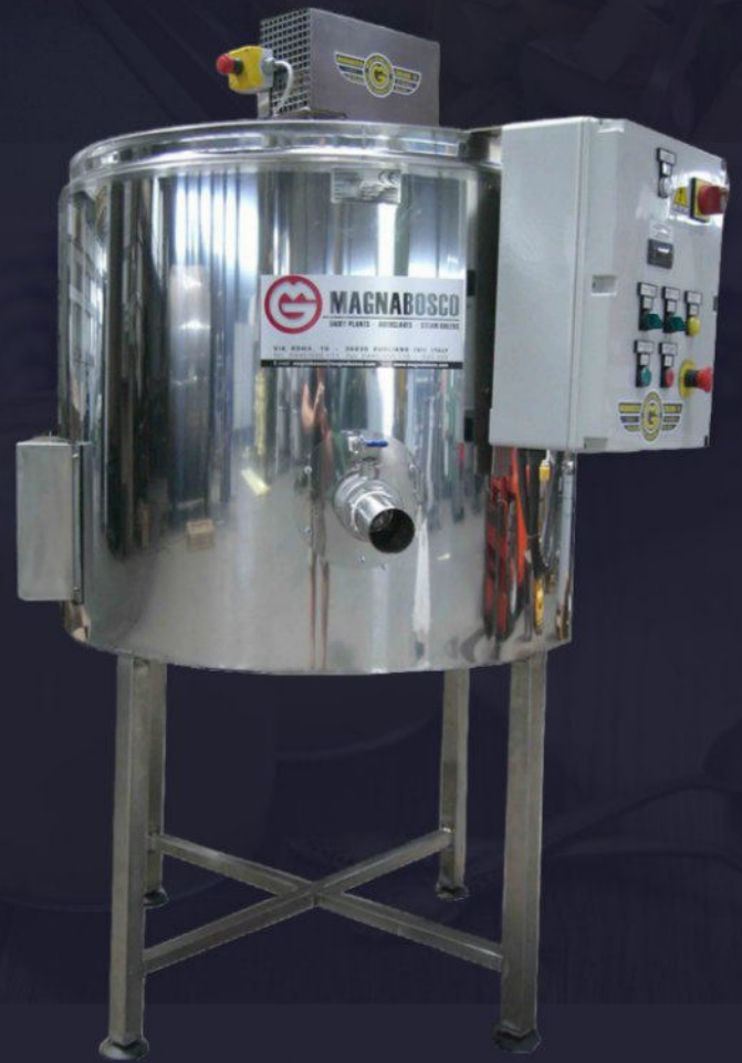
Cowbatch rialzato elettrico con valvola di scarico cagliata