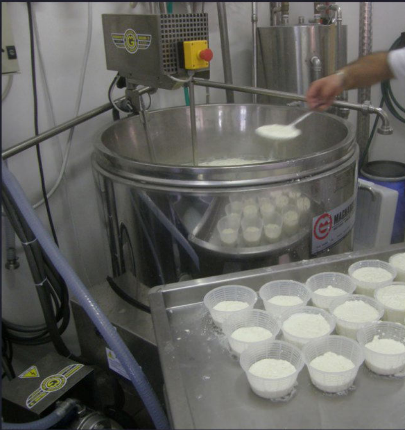
Foto della produzione casearia tramite Cowbatch