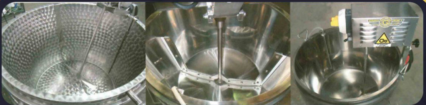
Finiture e agitatori