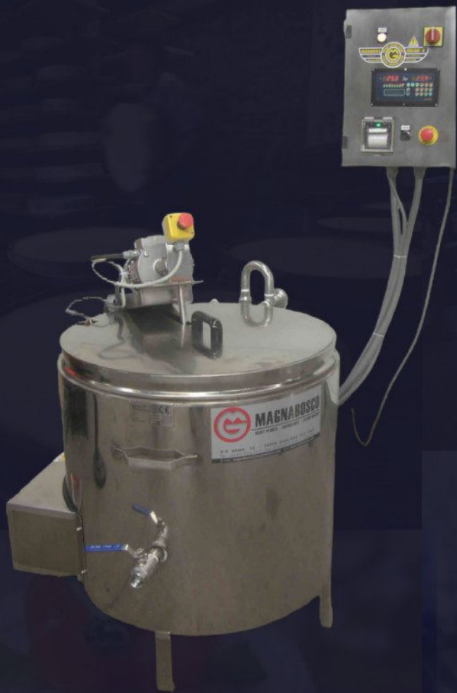
Cowbatch rialzato a terra elettrico con PLC e stampante