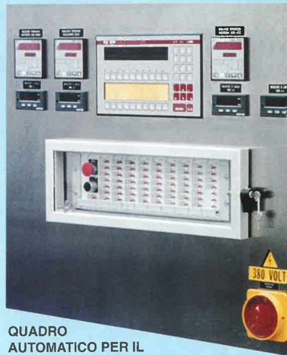
QUADRO AUTOMATICO PER IL COMANDO E CONTROLLO DEI CICLI E DELLE TEMPERATURE DELLA SALAMOIA, GESTITO DA MICROPROCESSORE A LOGICA PROGRAMMABILE (PLC)