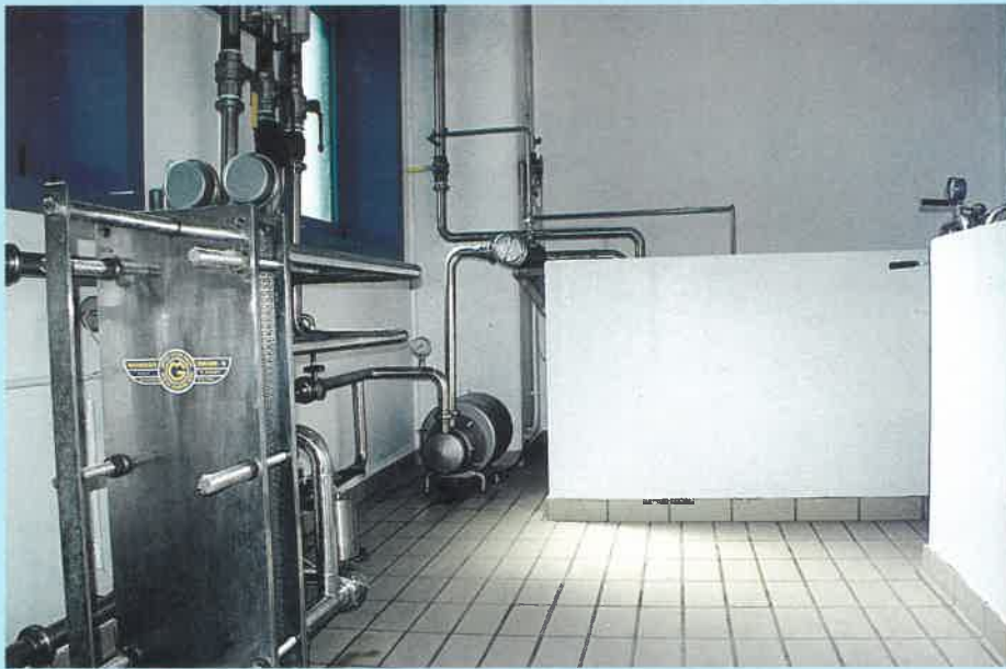
GRUPPO DI RICIRCOLAZIONE E REFRIGERAZIONE SALAMOIA CON VASCA PER LA FILTRAZIONE E PER IL RINNOVO DELLA CONCENTRAZIONE DEL NaCl.